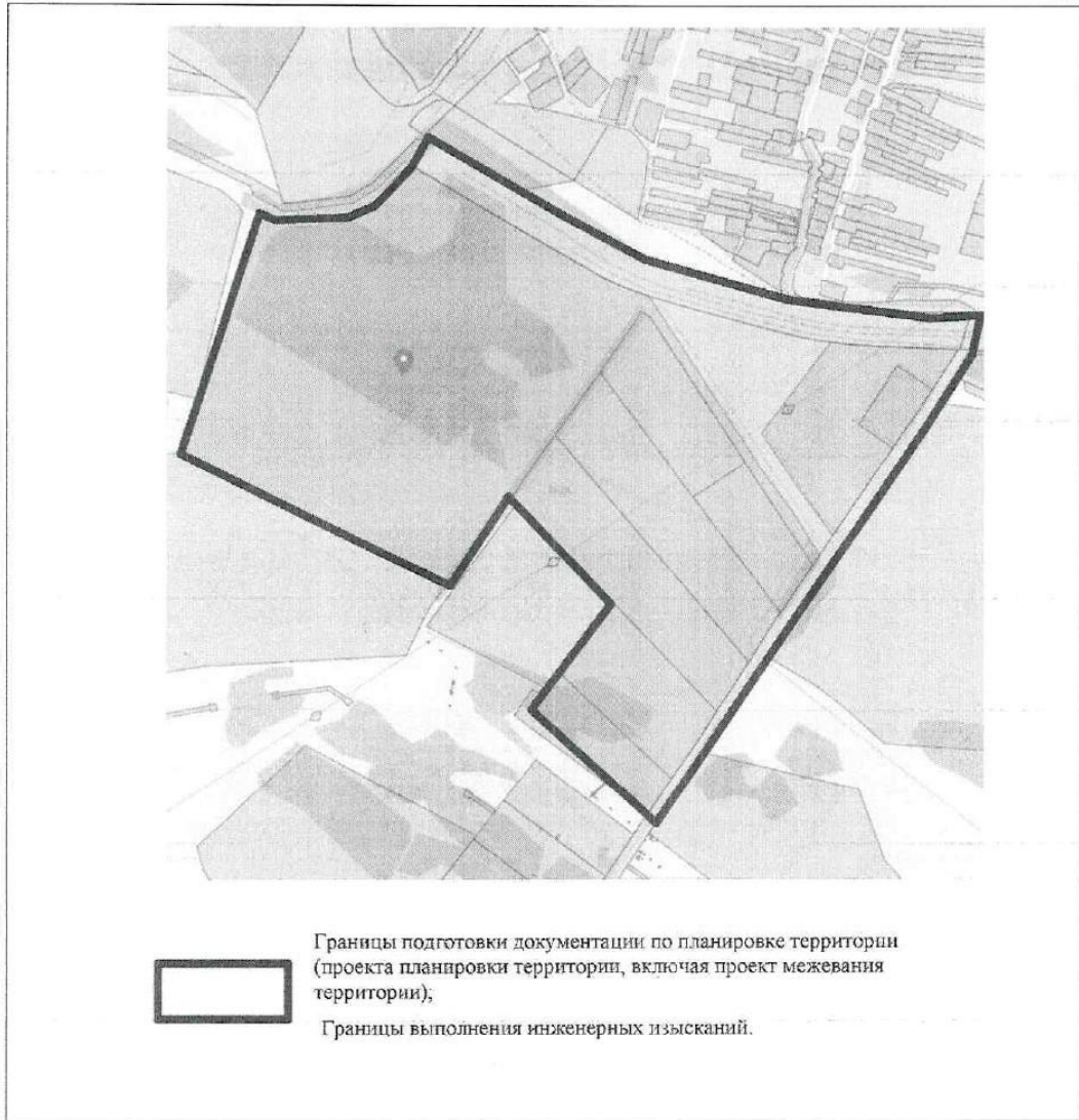
Схема границ подготовки инженерных изысканий