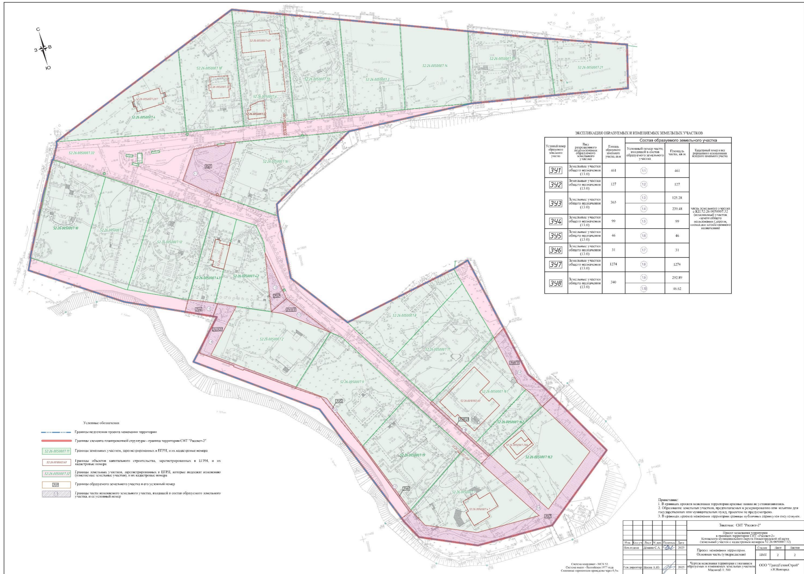
ЭКСПЛИКАЦИЯ ОБРАЗУЕМЫХ И ИЗМЕНЯЕМЫХ ЗЕМЕЛЬНЫХ УЧАСТКОВ