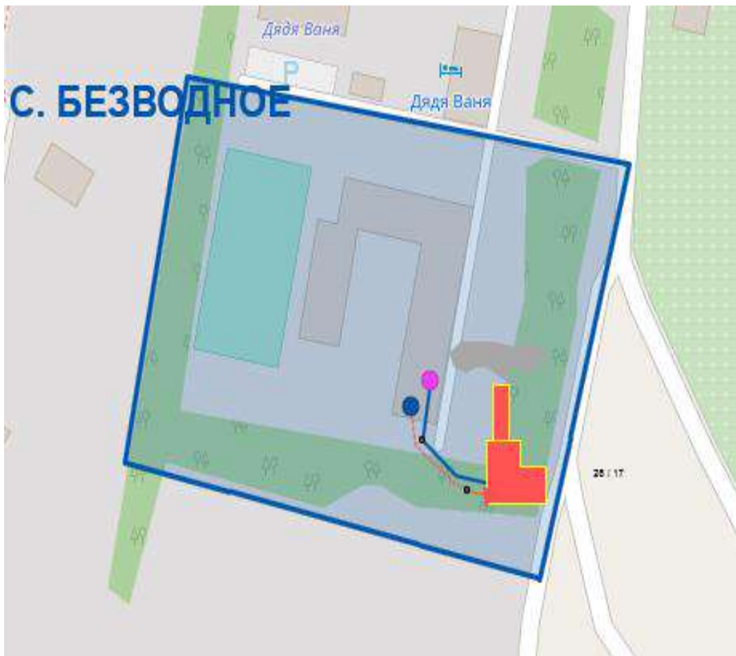
Рис. 2.1.1. Зона действия котельной МОУ СОШ с. Безводное