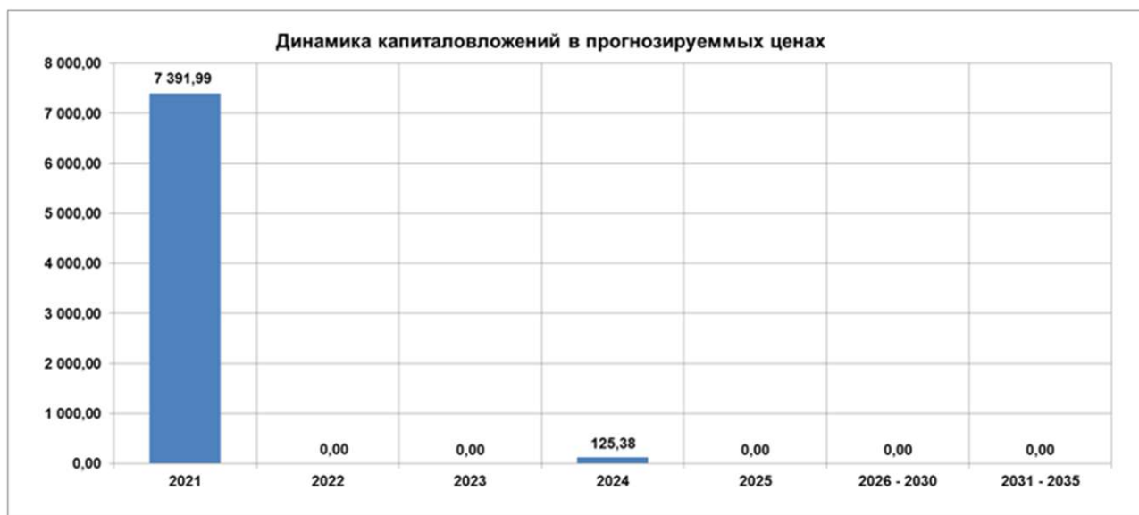
Рис. 15.2.1. Динамика вложений по годам в ценах 2020 г.

Динамика капиталовложений в мероприятия для котельных, находящихся в эксплуатационной ответственности филиала Нижегородский «ПАО «Т Плюс» Безводнинского сельсовета по годам в ценах 2020 г. приведена на графике рис. 15.2.1.