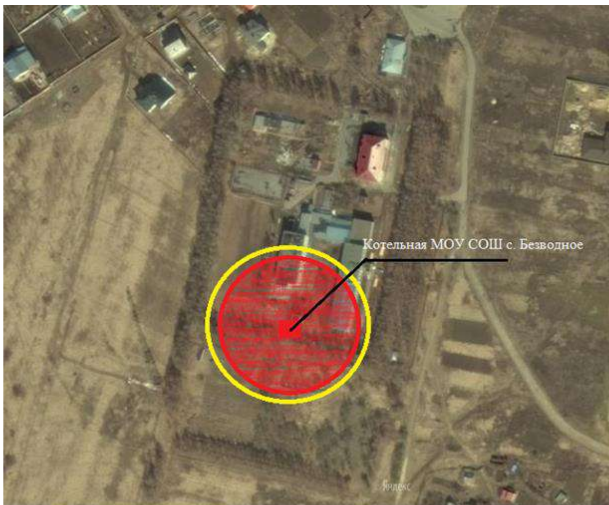
Рис. 2.1.1. Эффективный радиус теплоснабжения котельной с. Безводное