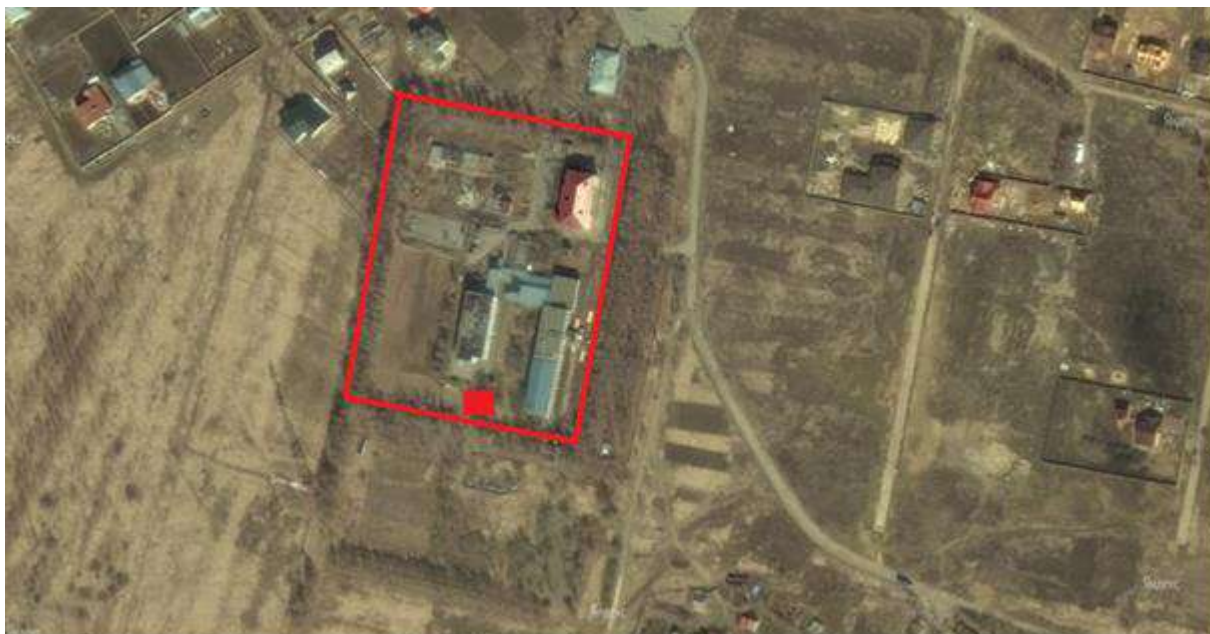
Рис. 2.2.1. Зона действия котельной с. Безводное

Увеличение существующих зон действия источников теплоснабжения не планируется.