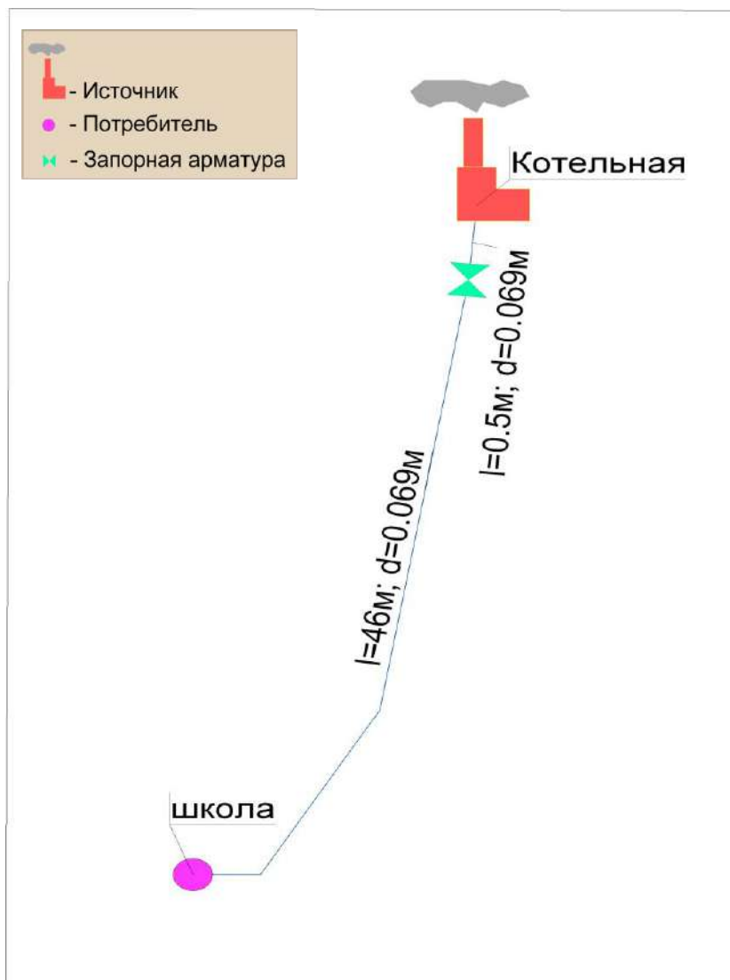
Рис. В4.1.Схема тепловой сети в зоне действия Котельной с. Безводное

Схема тепловых сетей в зонах действия источника тепловой энергии – котельных сельского поселения Безводнинский сельсовет Кстовского муниципального района представлены на рис.В4.1.