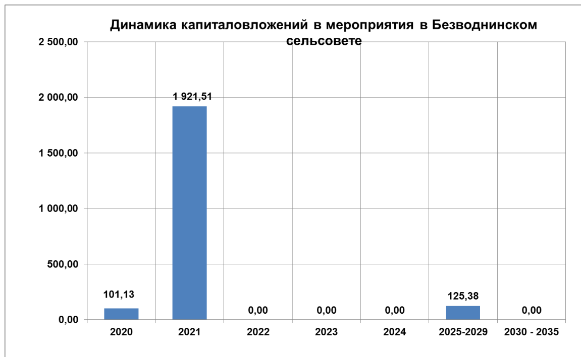
Рис. 15.2.1. Динамика вложений по годам в ценах 2020 г.

Динамика капиталовложений в мероприятия для котельных, находящихся в эксплуатационной ответственности филиала Нижегородский «ПАО «Т Плюс» Безводнинского сельсовета по годам в ценах 2020 г. приведена на графике рис. 15.2.1.