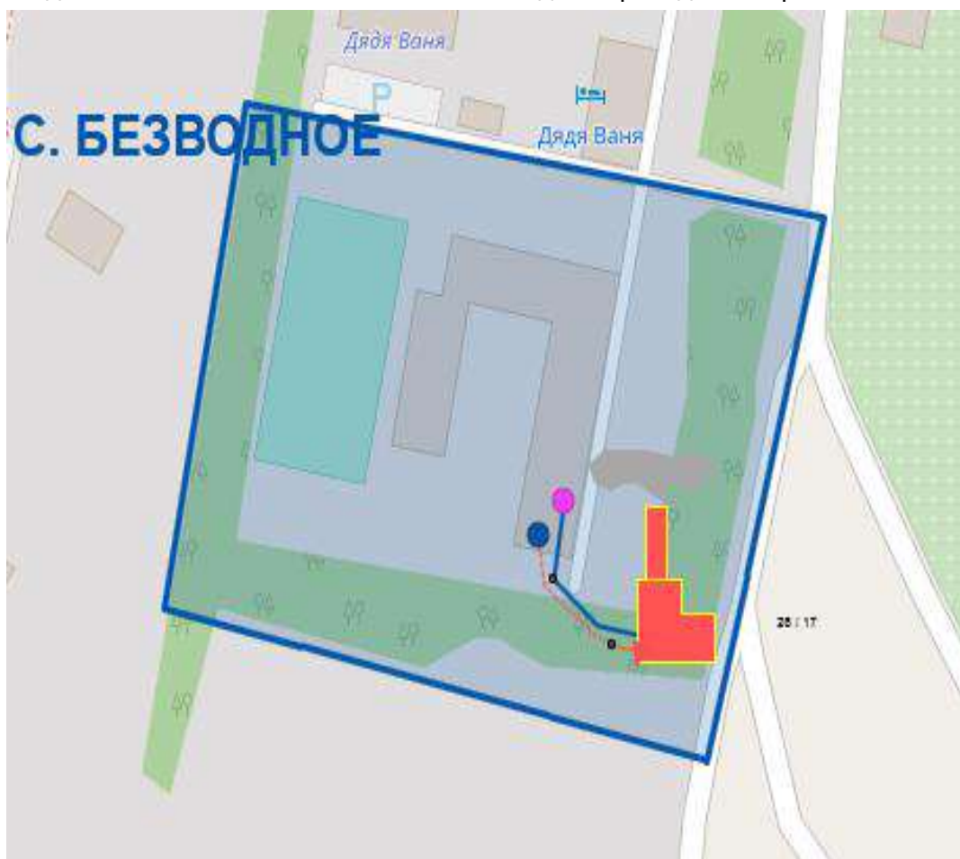
Рис. 2.1.1. Зона действия котельной МОУ СОШ с. Безводное

Зона действия котельной МОУ СОШ с. Безводное приведена на рис. 2.1.1.