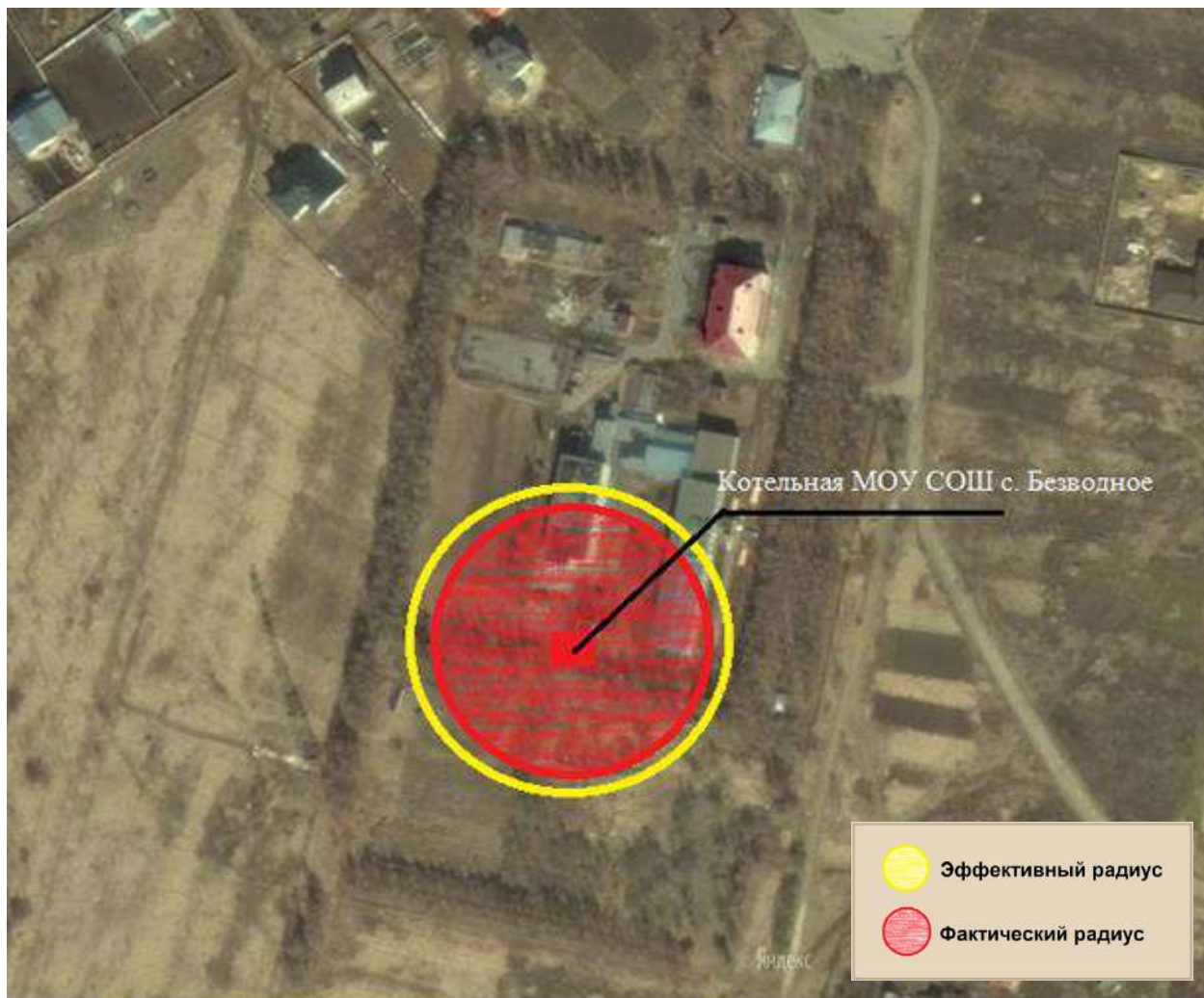
Рис. 2.5.1. Эффективный радиус теплоснабжения Котельной МОУ СОШ с. Безводное