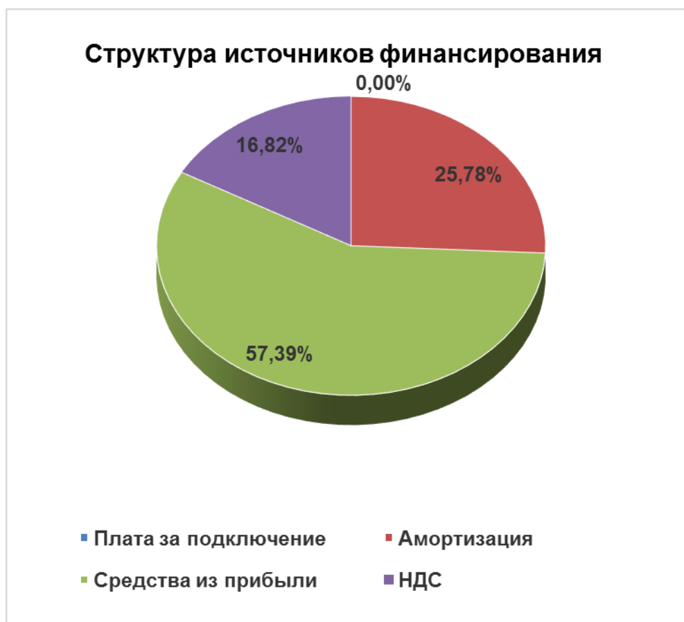
Рисунок 15.2.3. Источники инвестиций в зоне ЕТО № 1

Амортизация в общем объеме источников инвестиций составит 25,78%